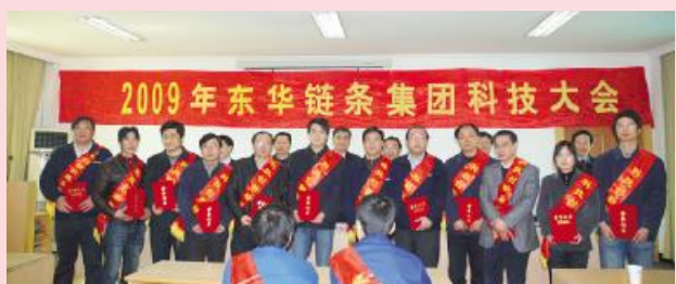
与会领导与科技创新标兵合影