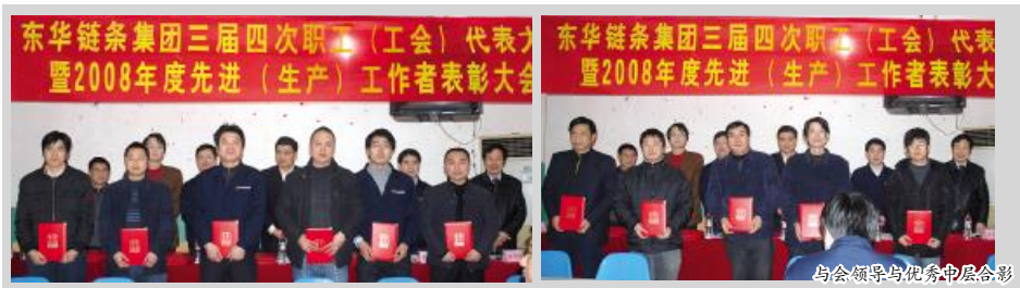
与会领导与优秀中层合影