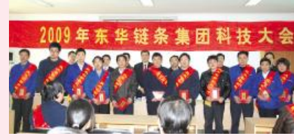
与会领导与技术创新积极分子合影