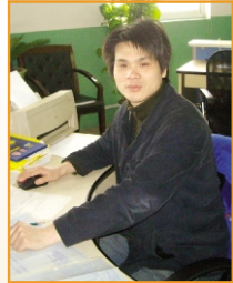
精益办 施建立:厚积方能薄发