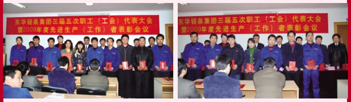
与会领导与岗位标兵合影