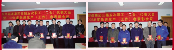
与会领导与优秀中层合影