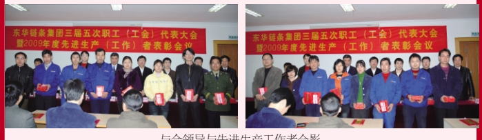
与会领导与先进生产工作者合影