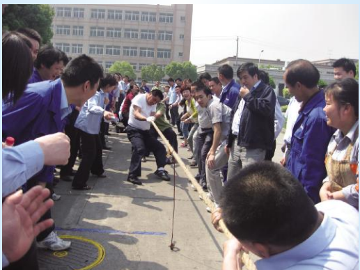
▲5月11日，东华集团工会组织开展了以“庆五一、迎世博”为主题的拔河比赛。参赛的10支队伍经过激烈的竞赛，输送链事业部一队获第一名；传动链事业部一队获第二名；输送链事业部二队获第三名；传动链事业部二队获第四名；管理部、财务部获第五名。