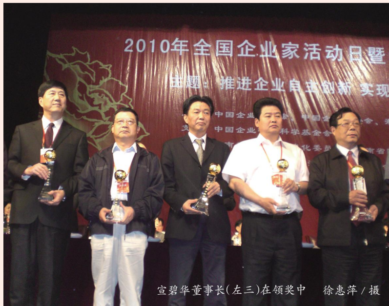
宣碧华董事长(左三)在领奖中