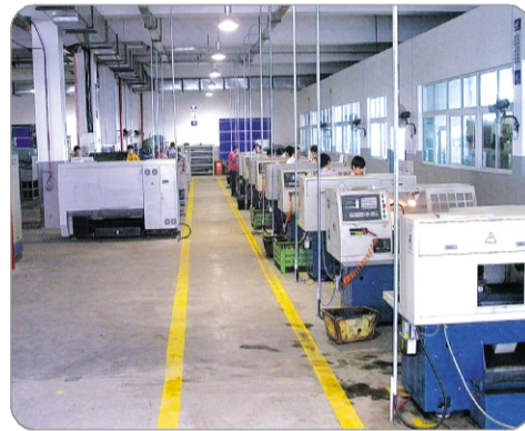
输送链事业部 通讯员

数控机床加工车间的成立,将为输送链事业部的可持续发展打下扎实的基础,使企业的装备水平更精良、更趋自动化。