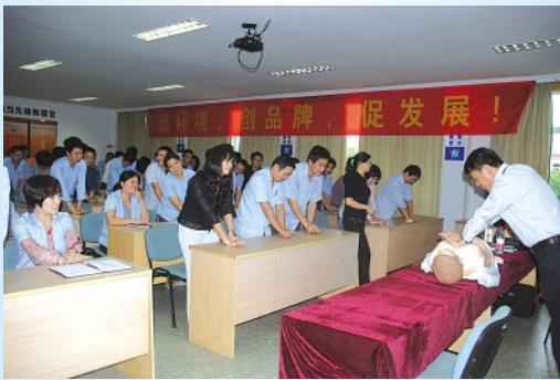
▲9月25日,集团邀请科普培训中心的老师对员工进行了一场紧急救护及健康知识普及培训活动。本次培训主要内容为流行性传染疾病症状与预防常识、CPR现场紧急救护知识(如人工呼吸、中暑急救、创伤、出血、触电等自救互救等)、职业疾病的预防及改善(如粉尘、放射性及其他有毒有害物质)和如何做好各种意外伤害事故的应急处理及地震逃生知识,来自各部门的50多名员工参加培训。 管理部