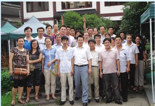
▲9月7日,输送链事业部工会组织了本部门20多名工龄满15周年以上的老员工座谈会,会上大家围绕事业部今年的经营目标、事业部5-10年的发展规划等话题展开了热烈的讨论,大家纷纷为事业部的各项工作献计献策。 输送链事业部