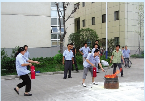
▲9月4日下午,管理部协助汽摩链事业部在新区举行了一场消防演练。本次演练共30多人参加。由管理部保卫人员给大家讲解消防的基本知识、消防器材的使用方法和步骤以及注意事项,在相关人员的指挥和调度下,消防演练圆满成功,提高了员工的消防意识,提升了事业部应对紧急事故的处理能力,对事业部安全生产起到积极的促进作用。 汽摩链事业部