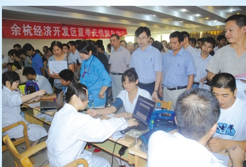
▲9月15日,东华集团一批献血志愿者聚集在雪花啤酒集团献血活动的大厅内,以自己的实际行动演绎了一曲“爱的奉献”。他们中很多都是“老志愿者”了,填表、测血压、排队化验,整个过程井然有序,符合献血条件的员工都很兴奋,积极献血,不符合献血的员工都希望下次能献血。“点点滴滴热血浓,人道博爱处处情”正是献血活动的真实写照。 管理部