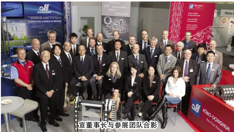
宣董事长与参展团队合影