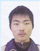
湖南理工学院武道