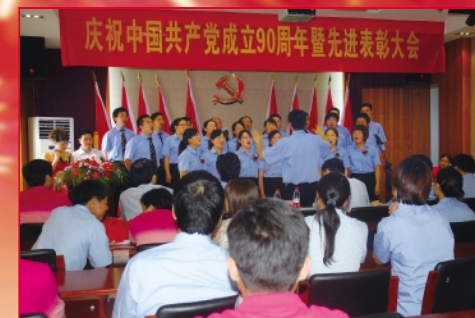
输送带党支部《歌唱祖国》一等奖