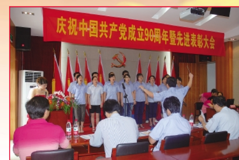
管理财务线党支部《团结就是力量》三等奖