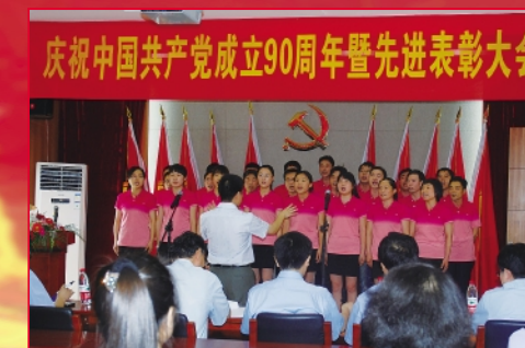
输送带党支部《没有共产党就没有新中国》二等奖