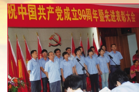
销售线党支部《歌唱祖国》