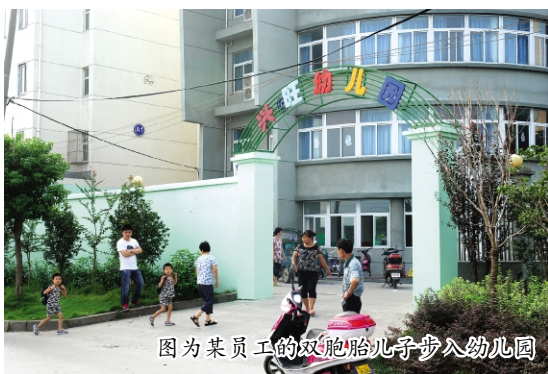
图为某员工的双胞胎儿子步入幼儿园

直十分重视解决员工子女上学问题。通过管理部和工会努力,近两年来,共解决几百名员工子女就近上学。为了方便员工子女上幼儿园,最大限度减少员工的负担,今年以来,管理部与工会相关领导多方奔走,最终引进一家幼儿园搬迁到东华家属楼开办。新的幼儿园占地1500余平方米,共200多名幼儿入学,其中东华子女100余名。