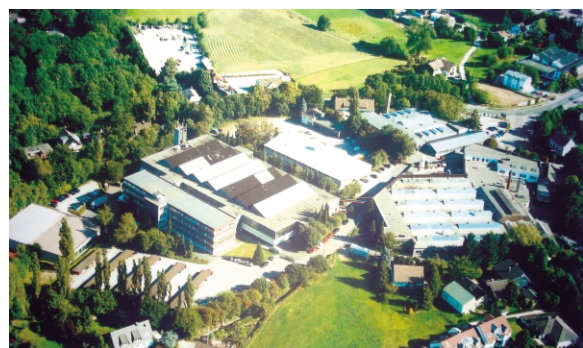
东华德国 KÖBO 公司全景

步入德国东华 KÖBO 公司,公司整体建筑设计无不体现于构思之精妙:三角形房屋构造确保了光线之聚汇效用,不仅可防止雨水渗透,而且很大程度上起到节能降耗作用。无论是办公区还是厂房区,墙体涂料也体现出德国人之长期效应。据说他们在造楼时优先考虑的就是对每一块墙体的精心打造,虽然时间较长,但绝不轻易进行随时拆换,德国用行动告诉我们,拆换和精心打造成本之得失。