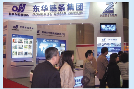
▲9月26日至28日,东华集团由内销处组团参加了第十六届上海国际冶金工业展,东华的特装展位设计美观,展出的大规格链条产品品种齐全,吸引了众多国内外客户的眼球,前来参观洽谈的客户络绎不绝,大大提升了东华链条在冶金行业的品牌形象。 内销处