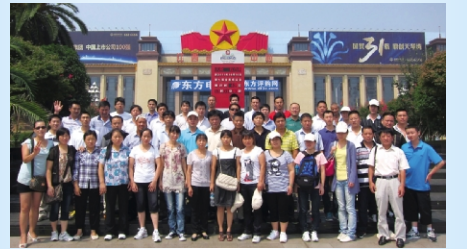
▲9月1日至4日、10月8日至11日,东华集团分两批共组织96名员工到江西南昌、庐山进行员工年度疗养。图为第一批疗养员工在南昌旅游后合影留念。 工会