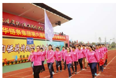
管理财务检测代表队