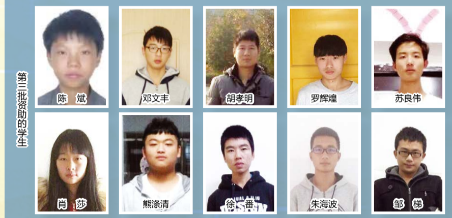
第三批资助的学生

为人谦和的阳光孩子。如今,第一、第二批受资助的大学生毕业后走上了工作岗位,其中有两位加盟东华集团,有两位加盟东风农机集团。 管理部