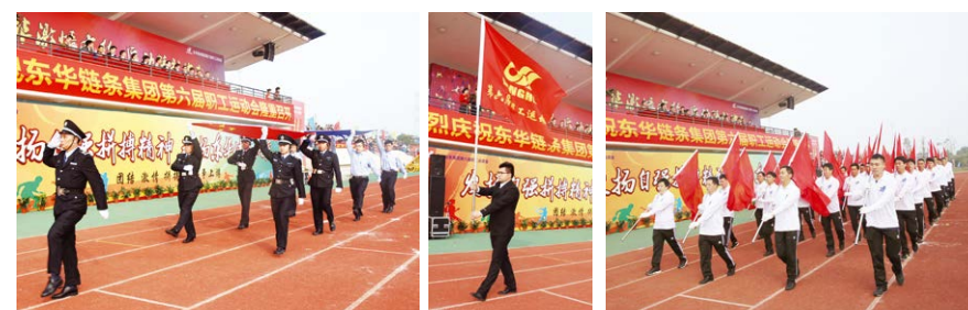
国旗厂旗队 会旗 红旗队