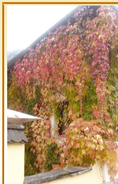
东华雨轩 秋意

董事长常说:不管形势如何,只要我们做好每一样工作,饭就有的吃。一个人如何做事,如何做好事是一种态度;一个企业如何发展,怎么发展好也靠一种态度。“态度”的力量是无穷大的,如今,我们企业的大方向“态度”明确,那么,就需要每一位员工也有一种积极向上的“态度”,让我们从我做起,从把我们的每一件工作做好开始,大家携手共进,一定能再创辉煌!