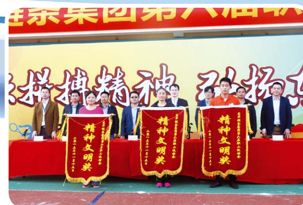
精神文明奖前三名