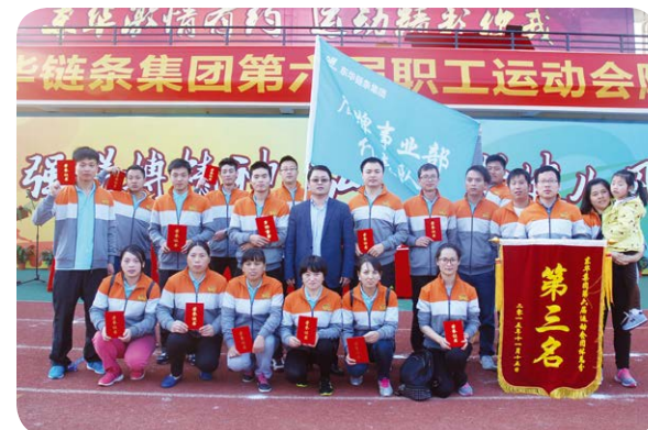
团队第三名 盾牌代表队