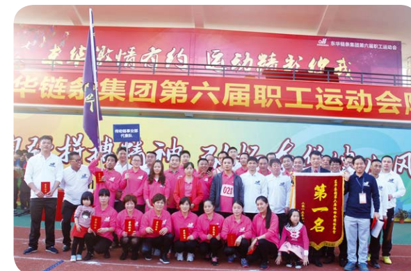
团队第一名 传动链代表队