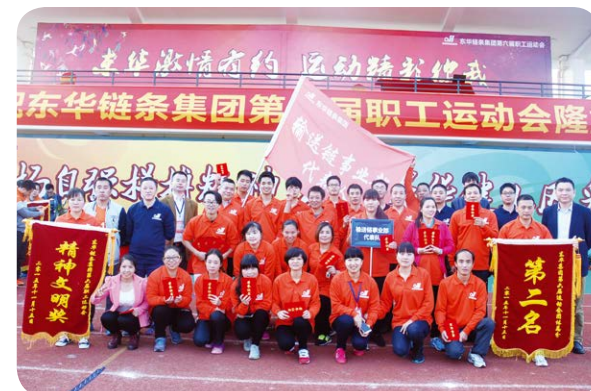
团队第二名 输送链代表队