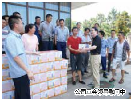
公司工会领导慰问中