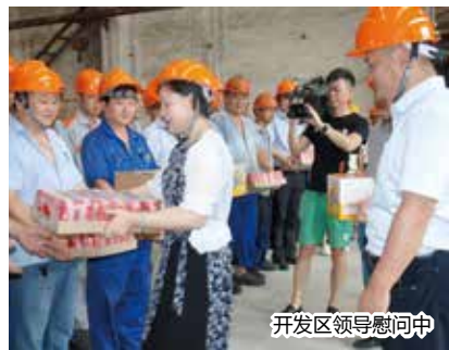
开发区领导慰问中

“高温送清凉”活动让公司对员工的关心落到了实处,进一步激发了员工的工作热情,加强了工会与员工之间的联系,增进了企业的凝聚力。