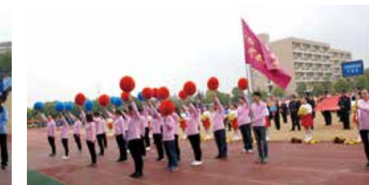
工程链事业部代表队入场