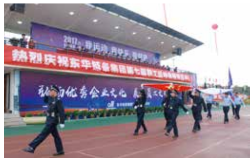
国旗队、厂旗队、会旗入场