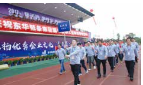
裁判员代表队入场