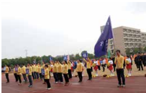
兴华链条公司代表入场