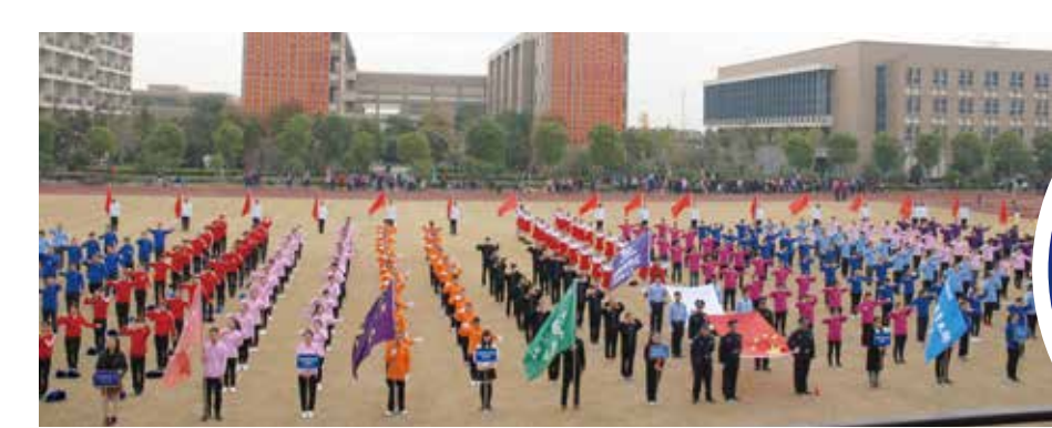
全体代表队手语表演