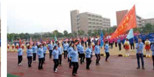
汽车链事业部代表队入场