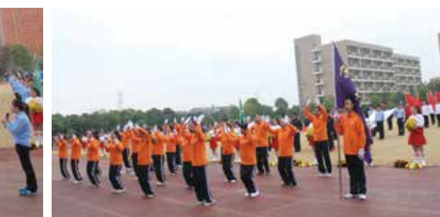
传动链事业部代表队入场