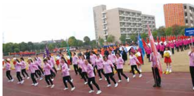
输送链事业部代表队入场