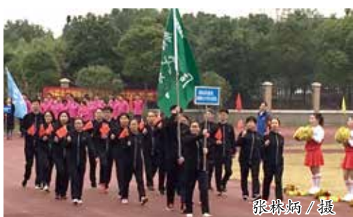
销售公司代表队入场