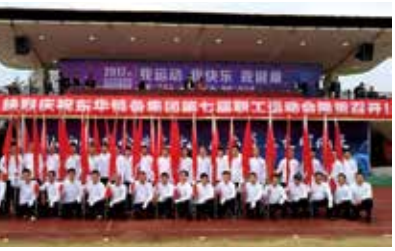
传动链事业部分工会

随着运动会的临近，红旗方队开始了正式训练。为了尽量不影响队员的工作，分工会利用中午半小时在食堂外进行集训。为了配合训练，队员们压缩中午吃饭的时间，训练中按照军训的标准严格要求自己，经过一个多星期的训练，这支由六个部门的员工临时组成的红旗方队已经被打造成一支充满活力的团队。