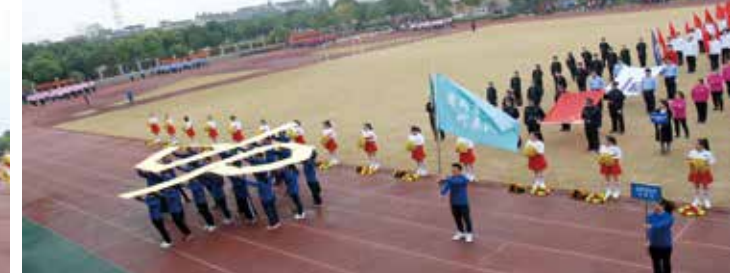
盾牌事业部代表队入场