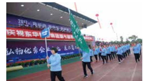
扶梯链事业部代表队入场