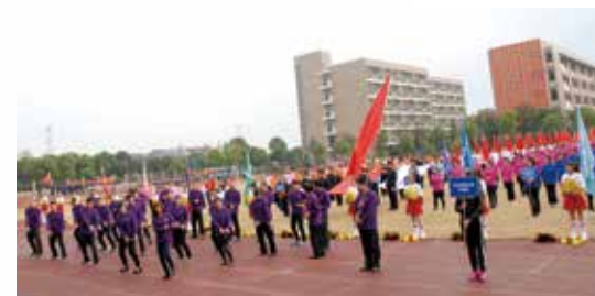
农机链事业部代表队入场