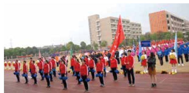
管理财务检测技术采购代表队入场