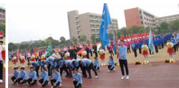
装备事业部代表队入场