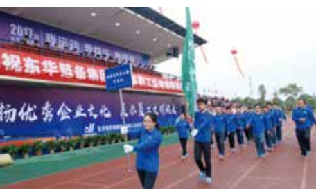
材料零件事业部代表队入场