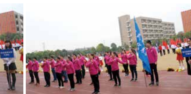
板式链事业部代表队入场