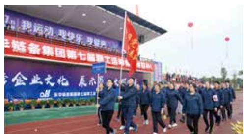
东华党群服务站代表队入场