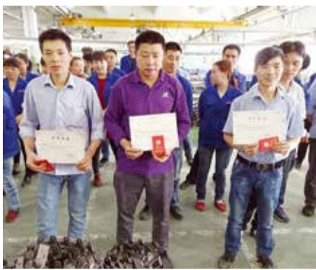
有效发货”做出自己的贡献。 通讯员 沈建明

通过本次手装技能比武大赛,充分调动了员工的积极性,使各员工都感受到了比赛中奋力拼搏、力争第一的精神,相信大家会齐心协力,为事业部“提高有效产出和