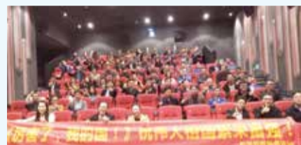
▲ 4月14日，为广泛动员全体党员、干部深入学习习近平新时代中国特色社会主义思想，东华党群服务驿站特组织100名党员、入党积极分子、优秀员工等观看了《厉害了，我的国》纪录电影片。