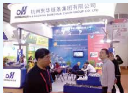
▲ 4月15日至19日，东华集团亮相广州第123届中国进出口商品交易会，展出了精密滚子链、齿形链、农机链、不锈钢链等，全面展示了企业的实力，扩大了东华链条品牌的国内外影响力。