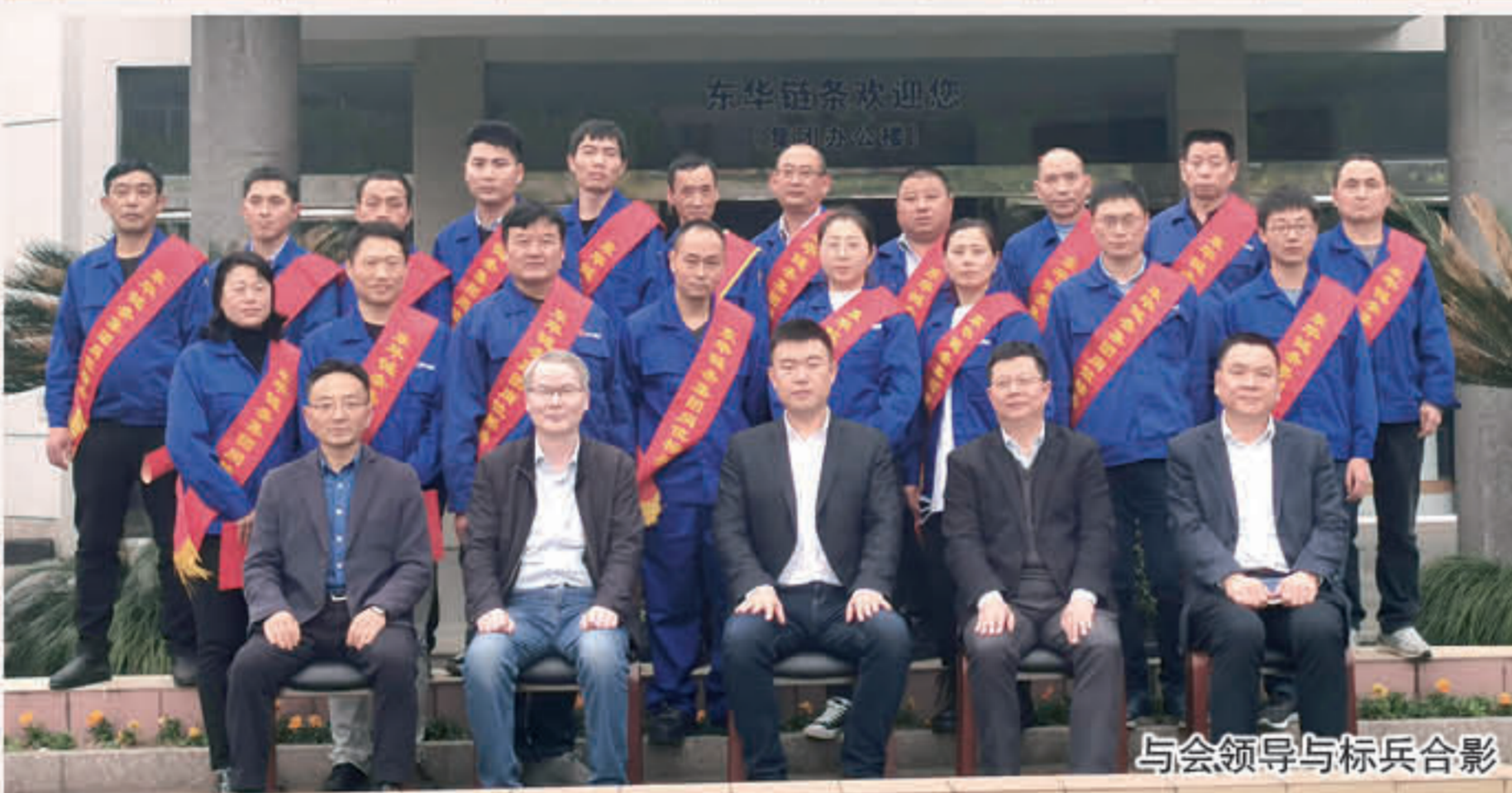
与会领导与标兵合影

效率领先，我们强调制造升级、产品升级、质量领先，但在质量领先的基础上不能丢失效率，否则我们就失去优势。管理也要效率，是不是足够扁平化，是否高效快速来应对市场的变化、客户的需求、交货期的缩短，为客户提供个性化定制解决方案。