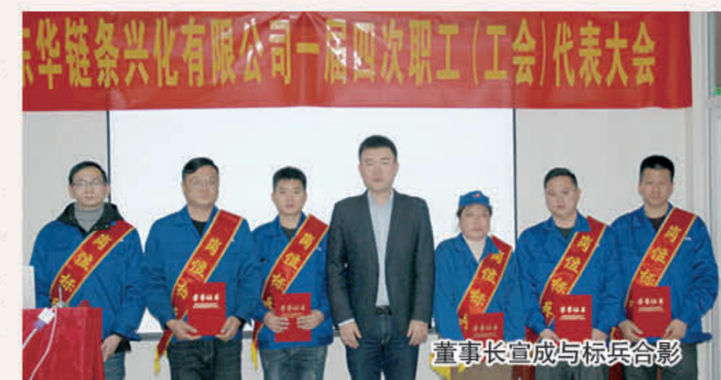
董事长宣成与标兵合影