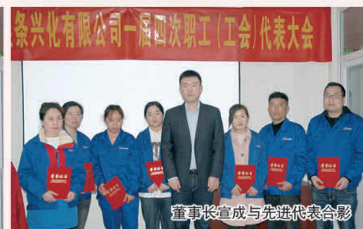
董事长宣成与先进代表合影