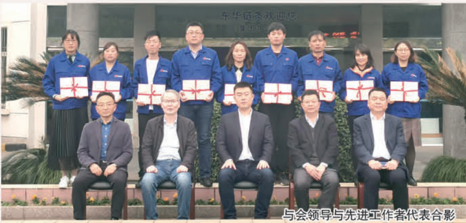
与会领导与先进工作者代表合影